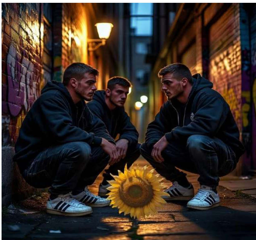
Рис. 1 Дополнительные вопросы на эрудицию