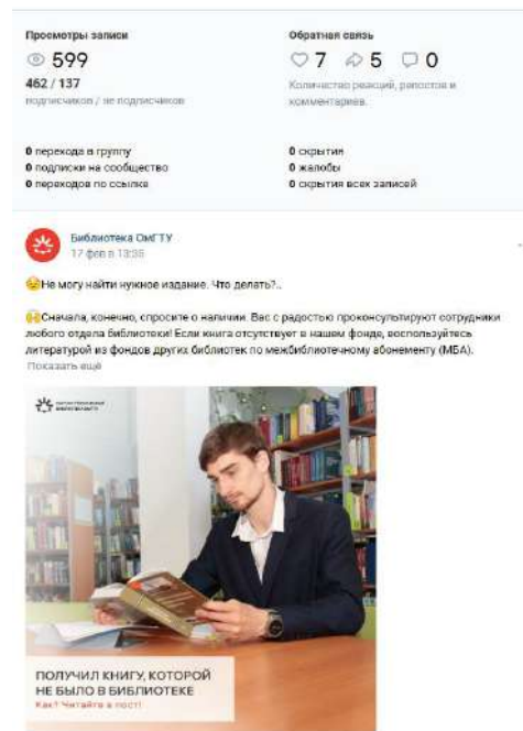
Рис. 2. Постер, в основе которого – фото человека (февраль 2026)

Изображение справа вызывает больший отклик у подписчиков.