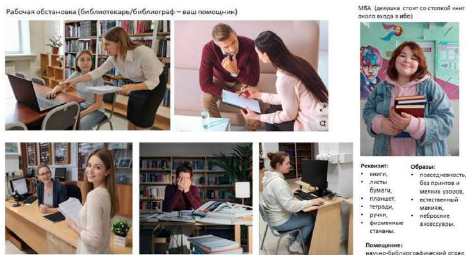
Рис. 3. Мудборд для предстоящей съемки

Все варианты подборок фиксируются на слайдах презентации. Концепт съемки отправляется участникам. При этом с ними обсуждаются идеи, которые предлагают и сами модели, оговариваются время и место сбора.