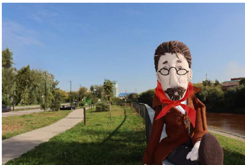
Рис. 2 Маскот библиотеки им. А. П. Чехова

Любопытно, что распечатанные подсказки, служившие закладками в книге, вызвали настоящий восторг у участников. Люди будто реально соскучились по бумажным носителям информации – невероятно, но факт.