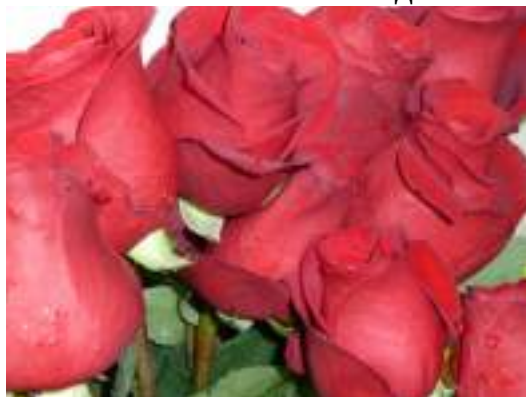
Цветы для победителей и «Книга Фестиваля»