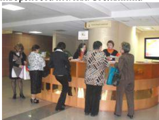
Регистрация участников и гостей Фестиваля