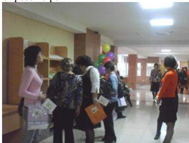
Посмотреть выставку и пообщаться с коллегами