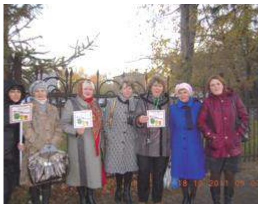
Встречаем участников и гостей Фестиваля «на дальних подступах» – у телецентра