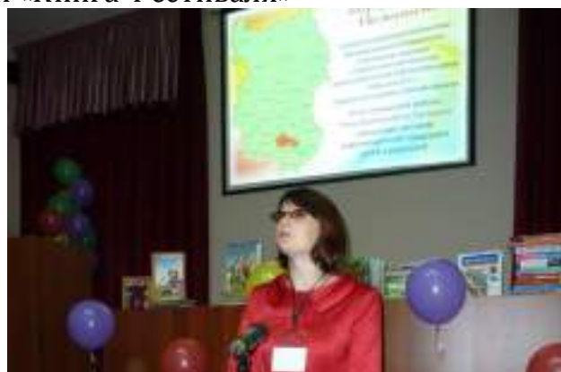
На экранах: состав жюри фестивального конкурса и «Библиотечная карта Фестиваля»