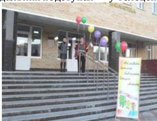
Первый день Фестиваля – в Научной сельскохозяйственной библиотеке Омского государственного аграрного университета им. П.А. Столыпина