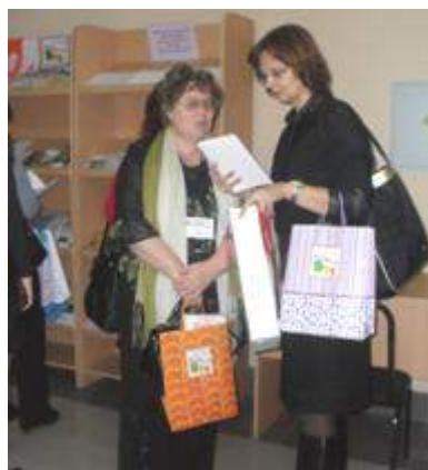
В «деловых пакетах» программа Фестиваля, блокнот, книга в подарок библиотеке