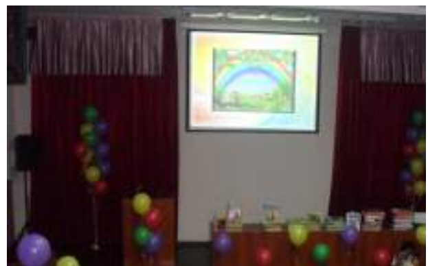
Победители фестивального конкурса представляют свои работы