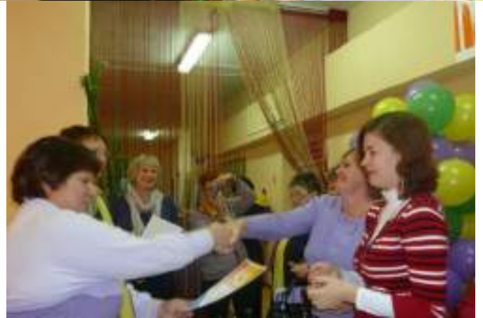
Подводим итоги Фестиваля, вручаем дипломы, цветы и подарки