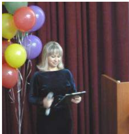
Торжественное открытие Фестиваля