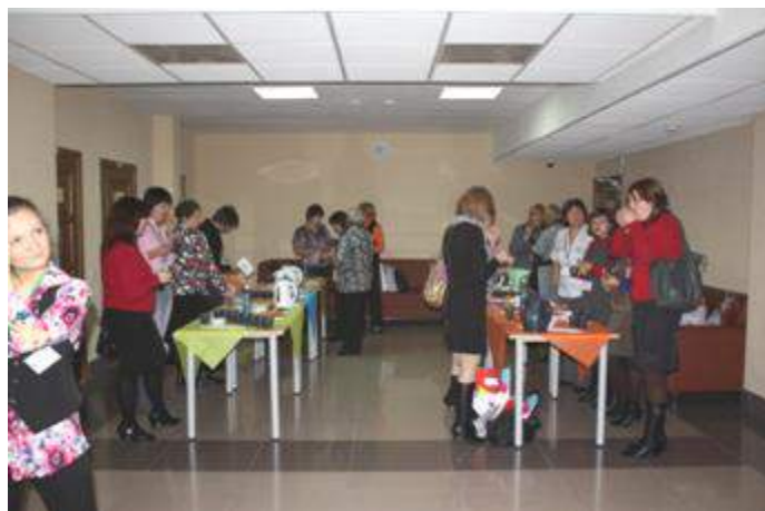
Выпить чаю в экспресс-кафе