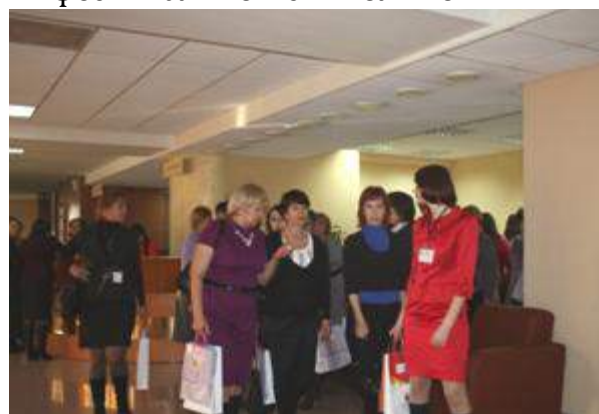
Пройти с экскурсией по Научной сельскохозяйственной библиотеке – и в зал