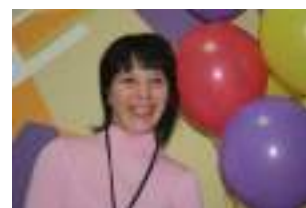
Сделать на память «фото с улыбкой» и фестивальной символикой