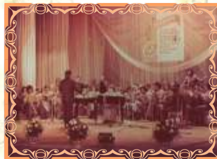
Тарский оркестр народных инструментов

директором и дирижером оркестра народных инструментов. Ему удалось не только сохранить коллектив, но и приумножить его успехи и достижения.